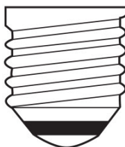
E27 IEC 7004-21