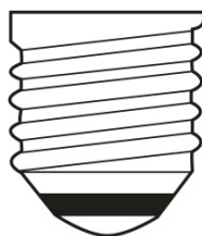
E27 IEC 7004-21