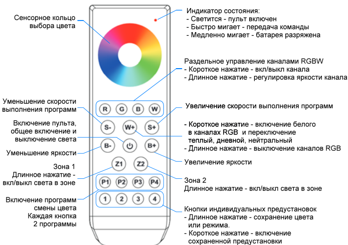
Рис. 1. Функции пульта.