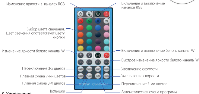
Рис.3. Управление контроллером.