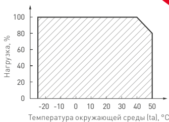
Рис. 3. Максимальная допустимая нагрузка, % от мощности источника.