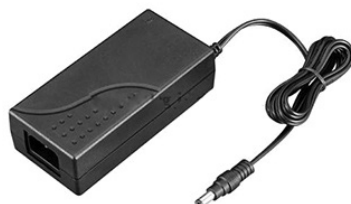
ARDV-90-24BD (24V, 3.75A, 90W)