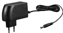
ARDV-18-5B (5V, 3.5A, 17.5W)