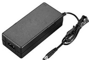
ARDV-60-24BD (24V, 2.5A, 60W)