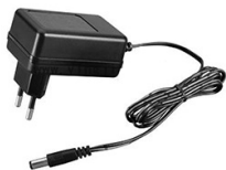
ARDV-15-5B (5V, 3A, 15W)