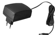
ARDV-20-5B (5V, 4A, 20W) ARDV-36-12B (12V, 3A, 36W)