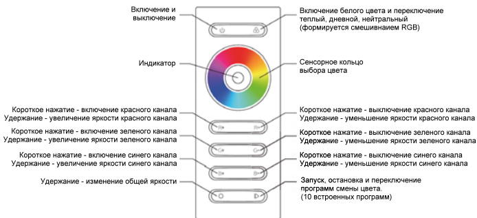
Рис.1. Функции пульта.