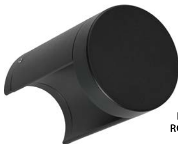
LGD-WALL- ROUND90 7W