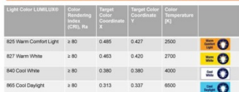
Light colors, color rendering properties and Light Color Coordinates for OSRAM DULUX® - lamps with integrated control gear

1 | Dateiname | ORG CODE | Initial Technische Zeichnung | T119000000